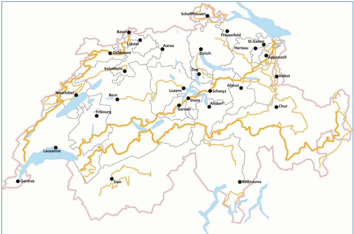
Carte : itinéraire pour VTT de La Suisse à VTT

Le VTT gagne en importance dans les régions touristiques en raison de la faible quantité de neige de ces derniers hivers et il est très apprécié dans les villes et les agglomérations pour les loisirs de proximité. Le trail du Gurten (région de Berne), par exemple, s'étend sur environ 1800 mètres de long et présente un dénivelé de 270 mètres. Il est en principe accessible à tous, même aux familles.